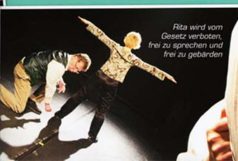
Rita wird vom Gesetz verboten, frei zu sprechen und frei zu gebärden