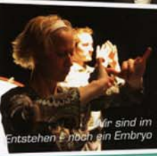
Wir sind im Entstehen = noch ein Embryo